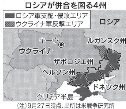
写真3 2022年度9月27日におけるウクライナ南部・東部の戦況