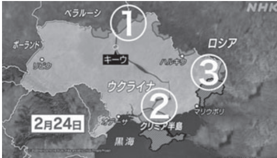
写真1 2022年度ウクライナ侵攻における3つの戦線